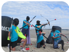
LE BATTLE ARCHERY

Le défi inter-entreprises est un relais sportif associant 4 disciplines accessibles à tous.