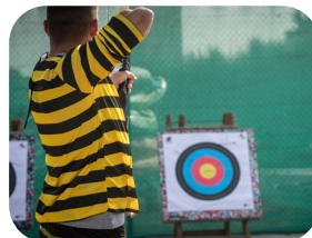
LE TIR À L'ARC