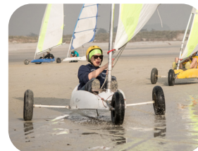
LE CHAR À VOILE

Nouveauté 2021 : Découvrez cette année une activité insolite avec Yllar, une belle surprise vous attend !