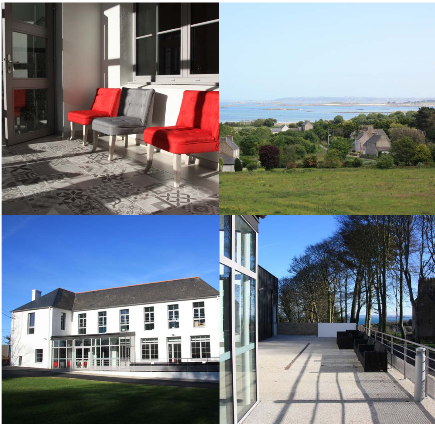
Le pavillon de Kersaliou et son extérieur.