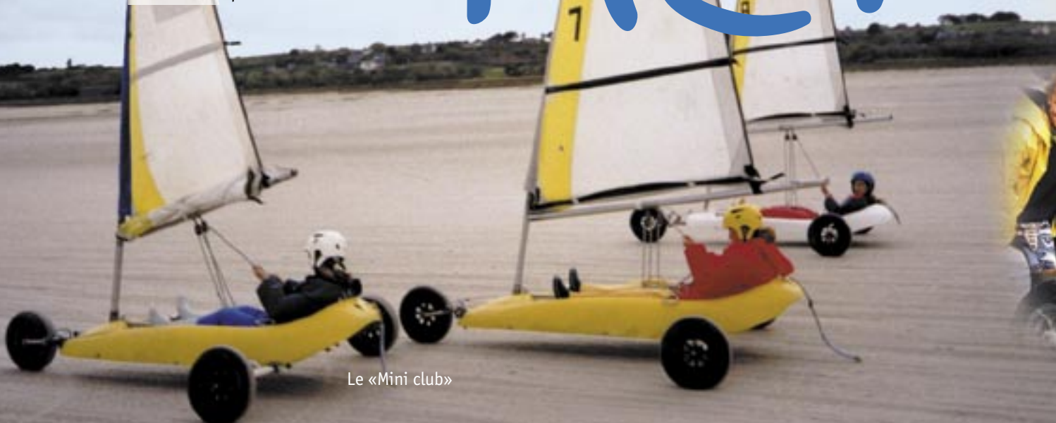
Le «Mini club»